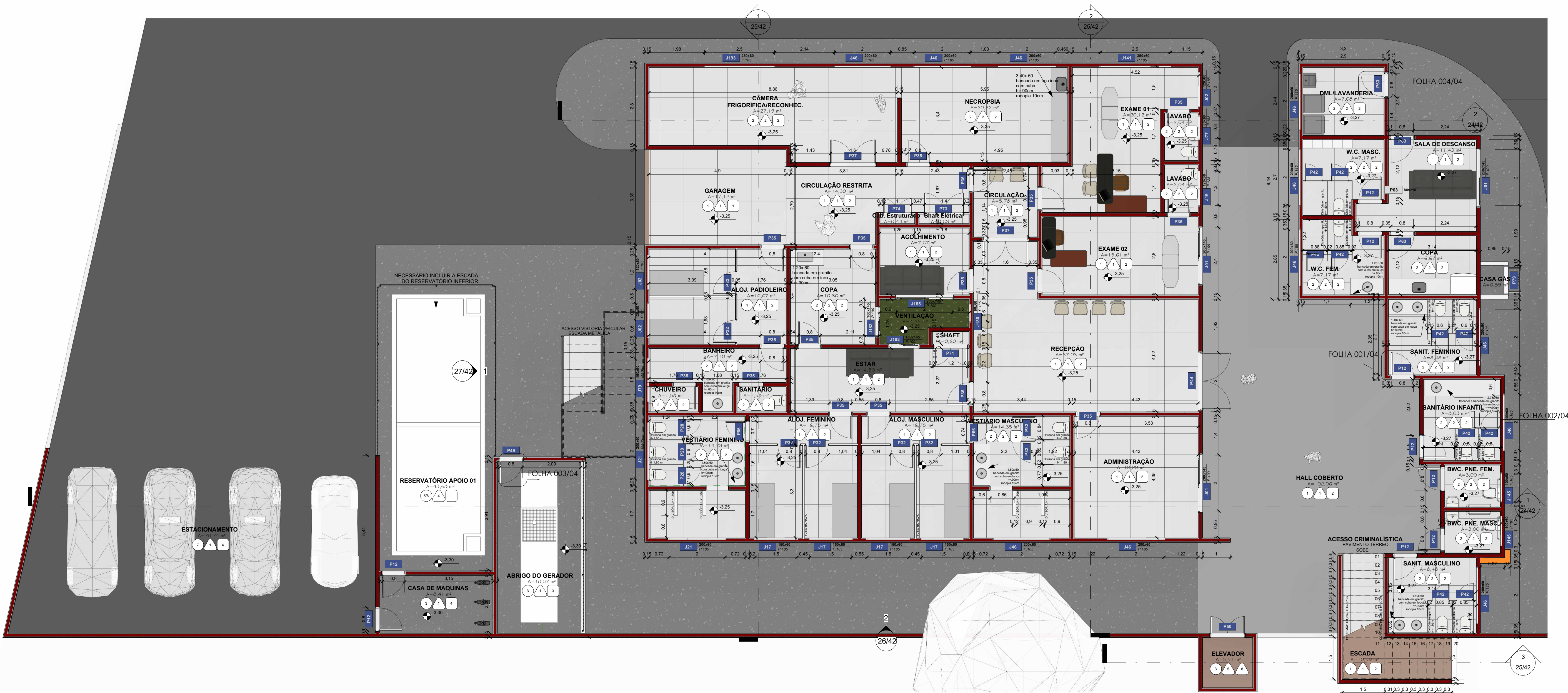
SUBSOLO - COGERP ESCALA 1 : 75